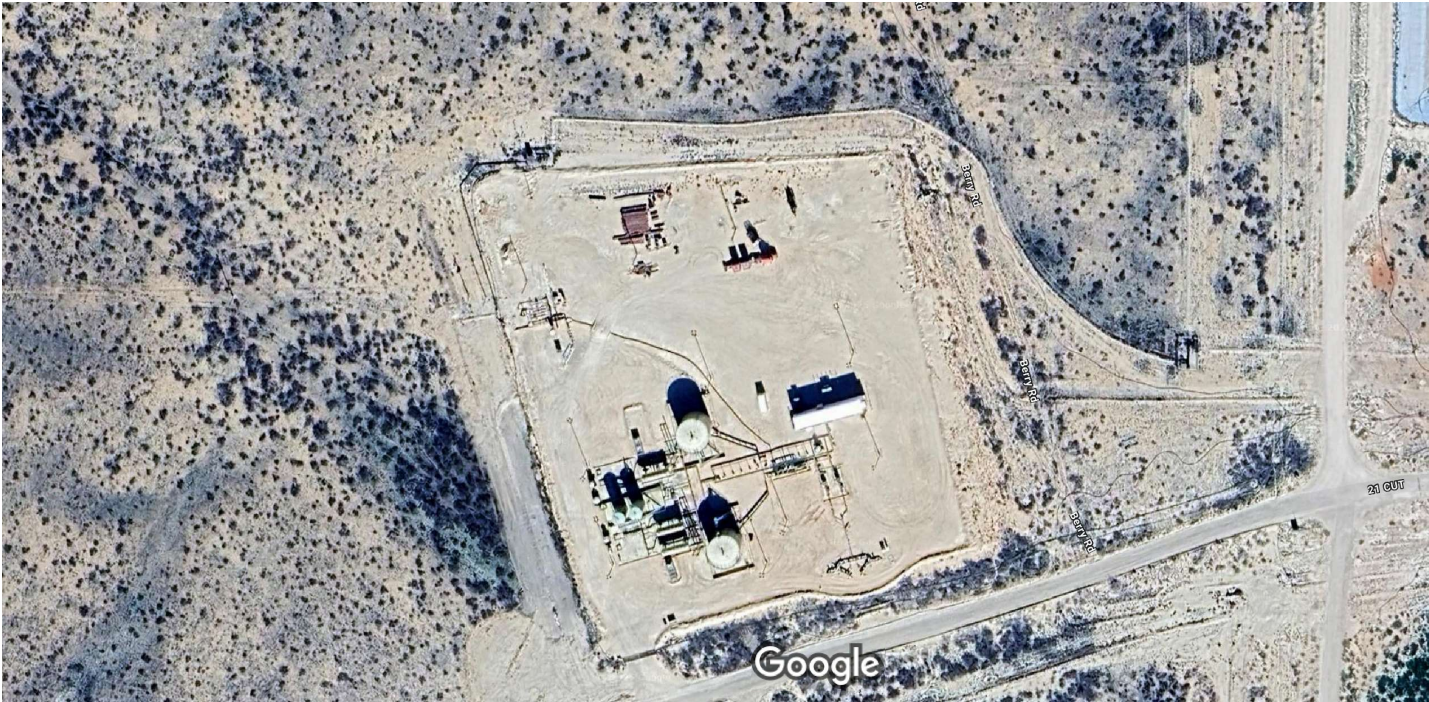
Imagery ©2025 Airbus, Maxar Technologies, Map data ©2025 50 ft